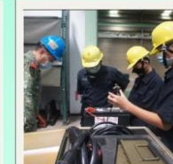
暑期營區 見學課程