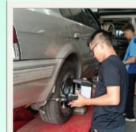
四輪定位 系統課程