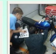
機車修護 證照課程