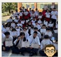
專業證照認證 取照率100%