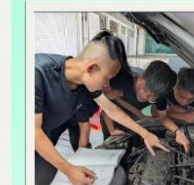
汽車修護 證照課程