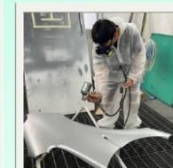
車輛板金 烤漆課程