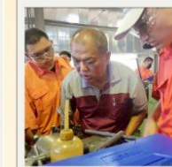
機械加工證照課程