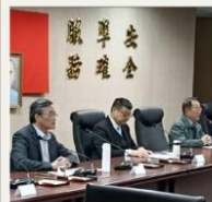
與臺灣鐵路公司 簽訂合作契約