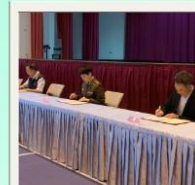
協同合作 聯合簽約典禮