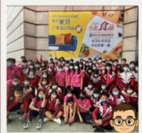
餐旅職涯體驗 校外參訪活動