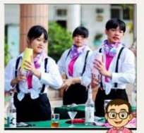
舞蹈調酒結合 創意傳統調酒