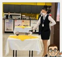
全國商業類科 餐旅技藝競賽