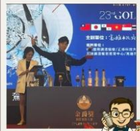
國際金爵獎 世界調酒大賽