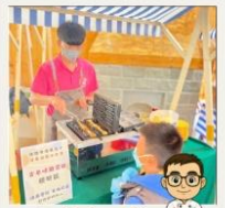
地方美食技藝 微創業課程